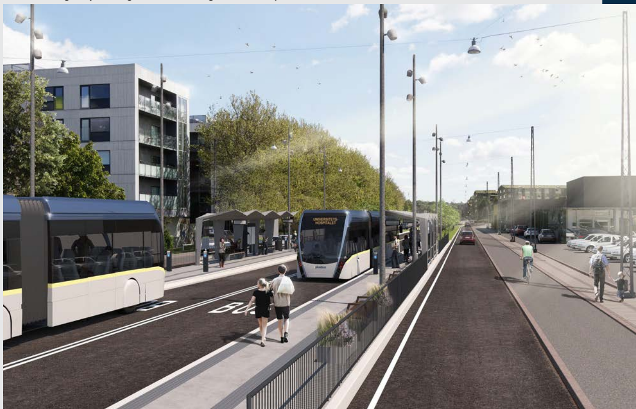
Visualisering – Jyllandsgade set fra Dag Hammarskjølds Gade mod øst