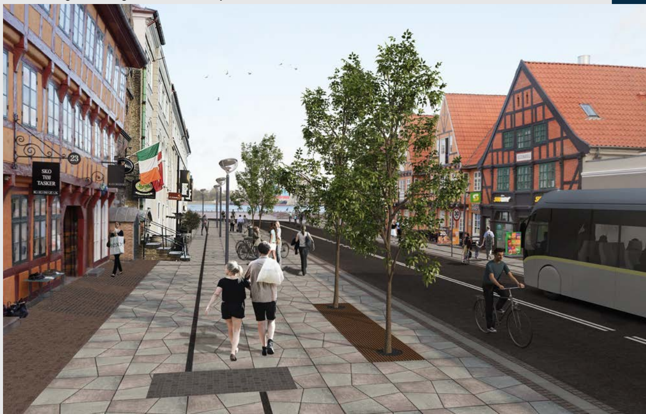
Visualisering – Østerågade set mod Limfjorden